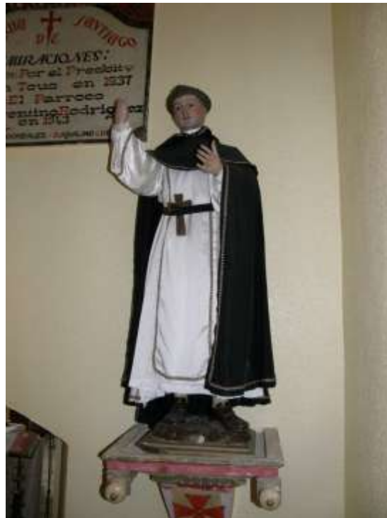
Imagen de vestir, aunque tallada en su totalidad de San Vicente Ferrer que previsiblemente perteneció a la iglesia de la Cruz antes de su derrumbe en los años sesenta del siglo XX. Sede de la histórica Cofradía de la Vera Cruz, su desaparición hizo se repartieran sus bienes muebles por templos de Medina del Campo y su comarca.

Su elección para procesionar excepcionalmente por las calles y plazas de Medina del Campo es debida a que representa al Santo Valenciano que instituyó las Procesiones de Disciplina, antecedente histórico más inmediato de las actuales Procesiones de Semana Santa. Sus sermones itinerantes congregaban a miles de fieles y penitentes que lo seguían pueblo a pueblo formando el Ejército del Pan.