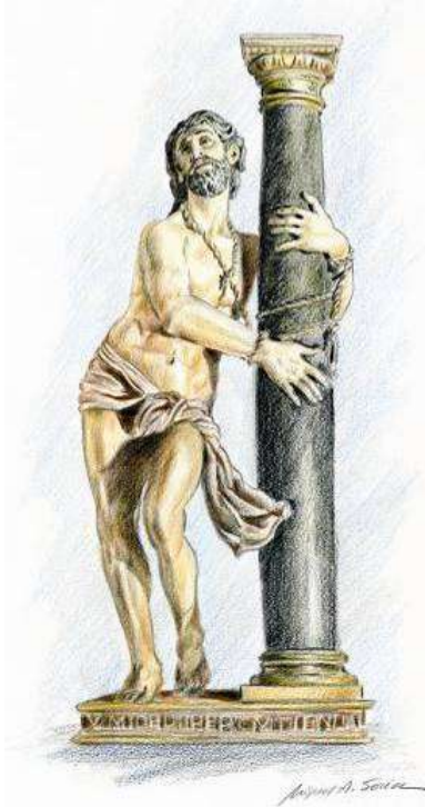
Imagen titular de la Cofradía Penitencial de Nuestro Padre Jesús Atado a la Columna, situada en la Iglesia de Santiago el Real. Se trata de una de las figuras más destacables de las tallas castellanas de la segunda mitad del siglo XVI, puesto que en esta época se impuso un tipo de columna baja, cuyo modelo se tomó de la columna de la Iglesia de Santa Práxedes de Roma, que se creía la original de la Pasión. Aquí nos encontramos con una columna que supera en altura a la figura de Cristo, como era característico en épocas anteriores.

El movimiento está magníficamente logrado. La cabeza, de gran dignidad, se levanta e inclina hacia atrás tensando la cuerda que anuda el fuste al cuello y las manos. Las piernas se doblan y obligan al cuerpo a abrazar la columna para no perder el equilibrio, captándose con gran realismo la sensación de fuerza en el apoyo. Aunque fue concebida como imagen de retablo y no como imagen procesional, las procesiones de Medina del Campo no se entenderían sin la participación de esta magnífica talla.